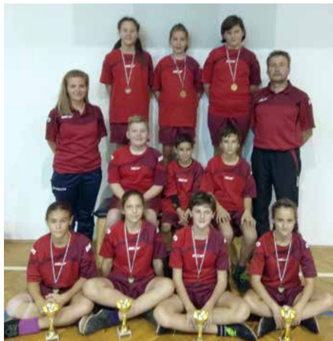
A 23. Gyermek Országos Bajnokság cserszegtomaji szereplői