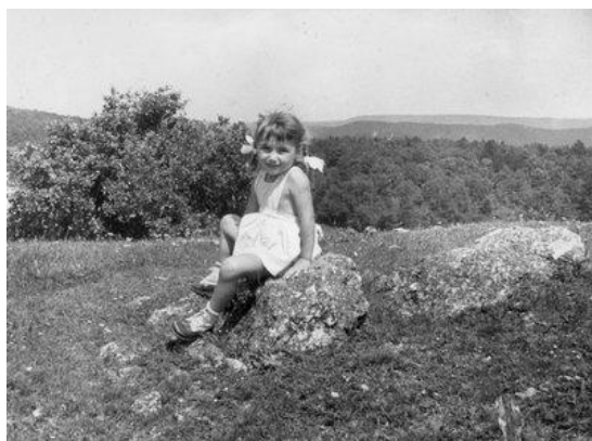
Kislány a gyötrösi tetőn 1960.