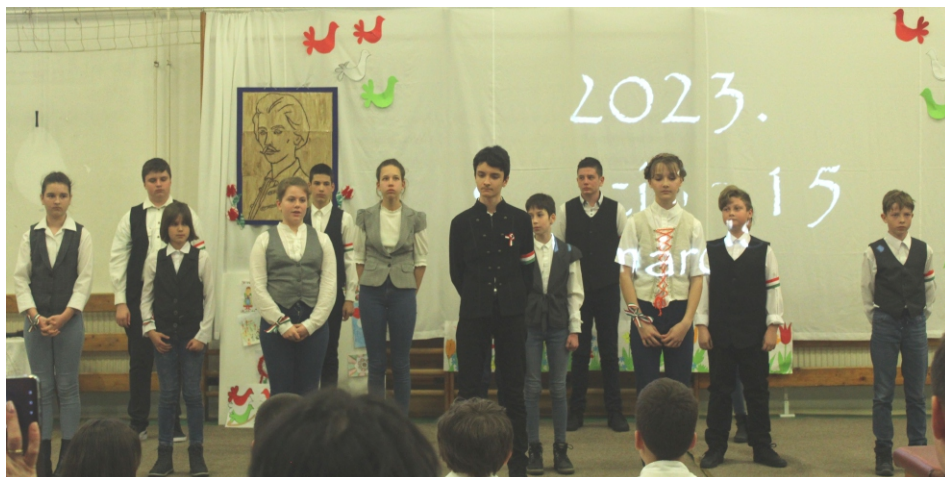
Szabó István Általános Iskola tanulóinak megemlékezése