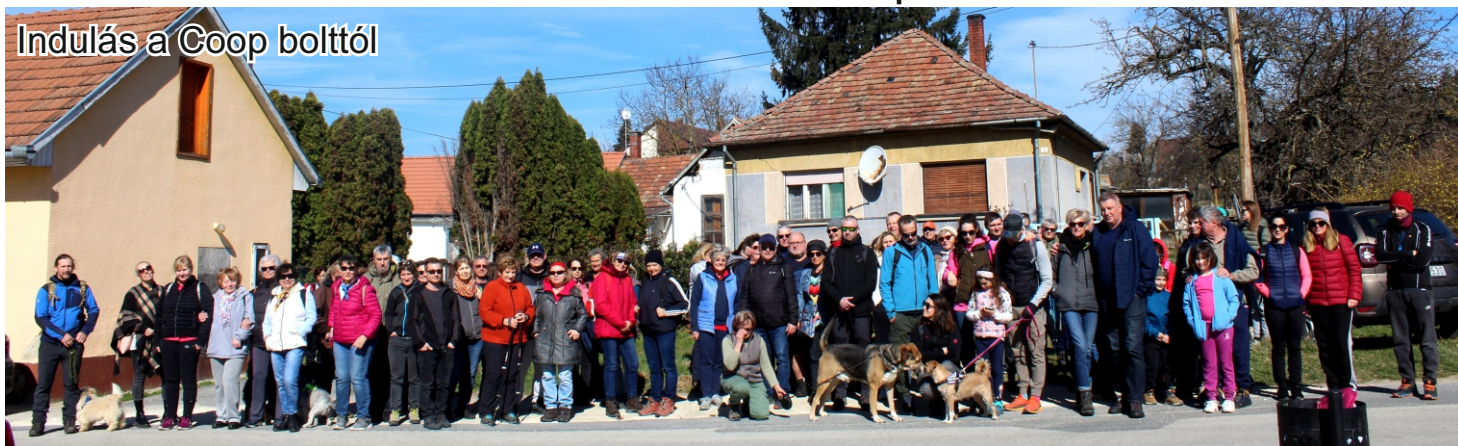
Indulás a Coop bolttól