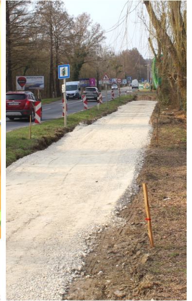
Az új bicikliút megtekintése