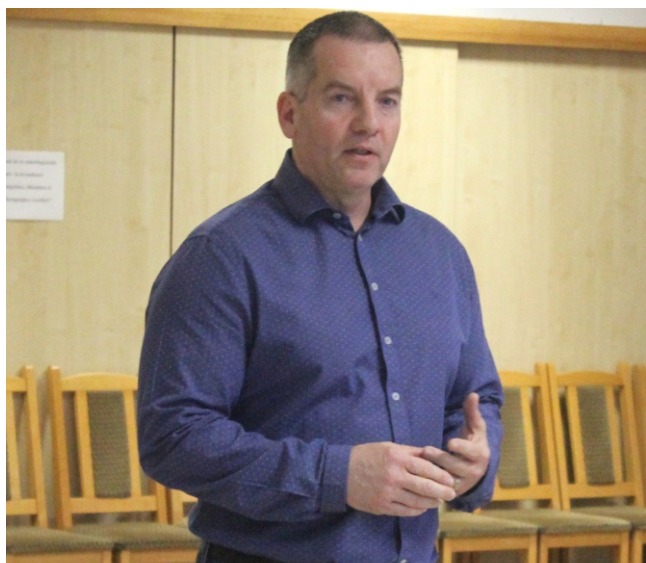
Elekes István polgármester a fejlesztésekről, összefogásról beszélt

2023. március 10-én Cserszegtomaj Nagyközség Önkormányzata II. alkalommal hívta közös gondolkodásra a helyi vállalkozókat. Idén 41 vállalkozás képviselői fogadták el a meghívást és mutatták be tevékenységüket.