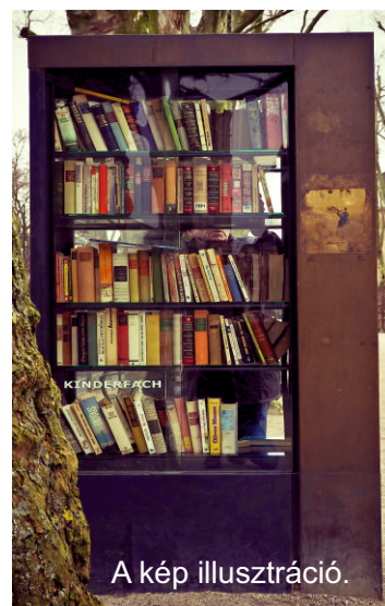
A kép illusztráció.

Kívánjuk, hogy sokak számára szerezzen majd örömet e kuckó!