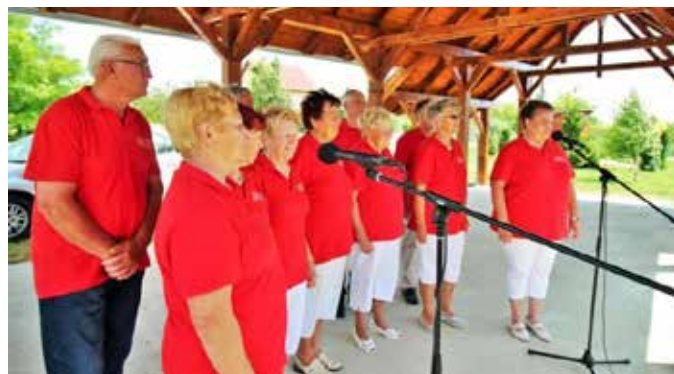
„Csácsbozsoki hegyen szólt a nóta”

A csácsi kezdeményezés folytatásaként, jövő évben mi leszünk a házigazdái e jeles eseménynek, melynek keretében ünnepeljük meg, klubunk 20 éves évfordulóját.