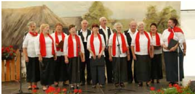
A Fesztivál a Cserszegtomaji Aranykorúak Nyugdíjas Klub műsorával kezdődött.

Az Aranykorúak Nyugdíjas Klubja az idei évben is meghívást kapott a Zalaapátiban, immáron 7. alkalommal megrendezésre kerülő Katonadal Fesztiválra. A szereplő kis csapat lelkesen készült a találkozóra, hiszen minden évben egyre nagyobb kihívás ez a résztvevő dalköröknek, nagy az igény a megújulásra, a még szebb, még színvonalasabb produkciók előadására. A rendezvényen több mint 20 fellépő csoport: dalkörök, kórusok produkciói hangzottak el. Előadásunkban I. és II. világháborús katona és fogoly énekeket hallhatott a nagydíjű közönség.