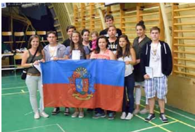
A Czerszegtomaji SK nemzetközi verseny résztvevői

Következő felnőtt verseny szintén a távoli Újszászon lesz. Ez lesz a felnőttek leghosszabb versenye, hiszen a két nap alatt minden versenyszámban mérhetik össze az egyesületek a tudásukat (női csapat, férfi csapat, női páros, férfi páros, vegyes páros, női egyéni és férfi egyéni).