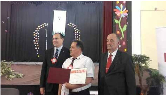
Cserszegtomaj” Humanitárius Település” Oklevél átadás - átvétel, Mezőkovácsháza

A házigazdák helyi értékekkel, specialitásokkal lepték meg a vendégeket.