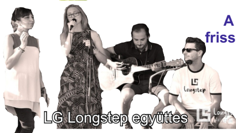
LG Longstep együttes