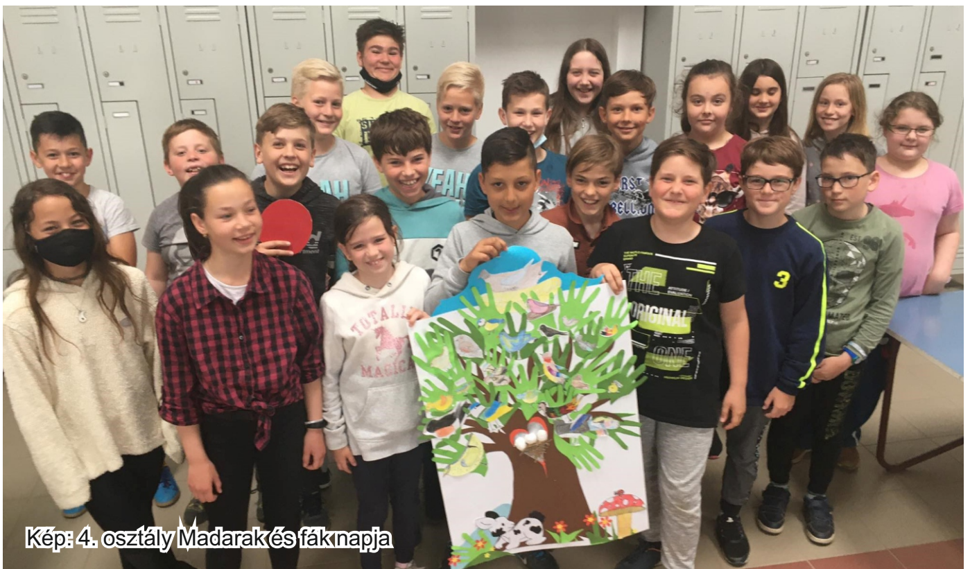
Kép: 4. osztály Madarak és fáknapja