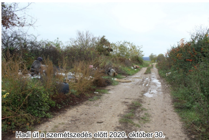
Hadi út a szemétszedés előtt 2020. október 30.